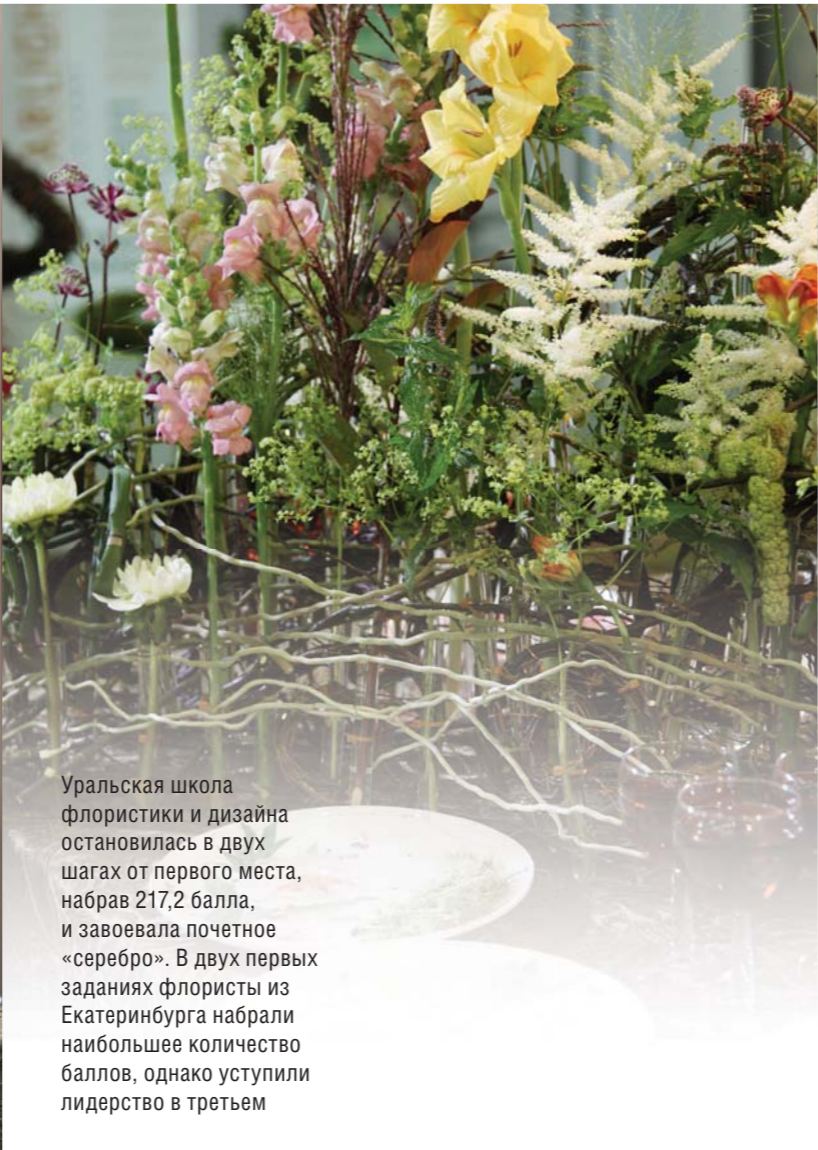
Уральская школа флористики и дизайна остановилась в двух шагах от первого места, набрав 217,2 балла, и завоевала почетное «серебро». В двух первых заданиях флористы из Екатеринбурга набрали наибольшее количество баллов, однако уступили лидерство в третьем