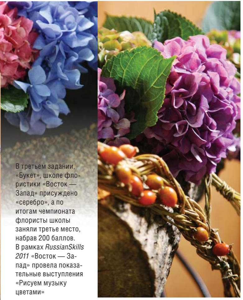
В третьем задании, «Букет», школе флористики «Восток — Запад» присуждено «серебро», а по итогам чемпионата флористы школы заняли третье место, набрав 200 баллов. В рамках RussianSkills 2011 «Восток — Запад» провела показательные выступления «Рисуем музыку цветами»